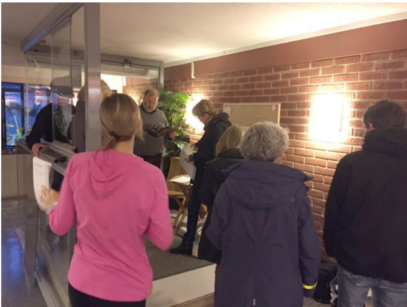
En provbalkong har byggts i entrén till hus 4.

På projektets informationstavlor i entréerna samt på hemsidan kan Du hålla Dig uppdaterad om vad som händer.