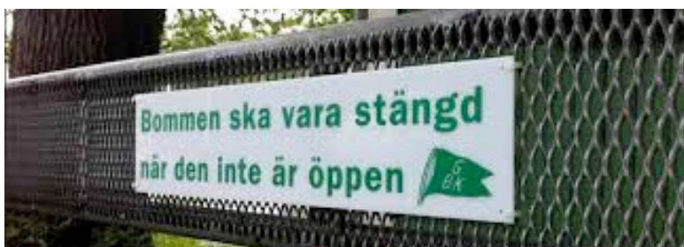
Avdelningen för roliga skyltar

Lägenheten får endast hyras av föreningens medlemmar och är tänkt som tillfällig övernattningslösning för gäster till boende inom bostadsrättsföreningen. Den som hyr gästlägenheten skall ha med sig lakan och örngott (alt sovpåse) och handdukar. Tvål och schampo finns inte i lägenheten.